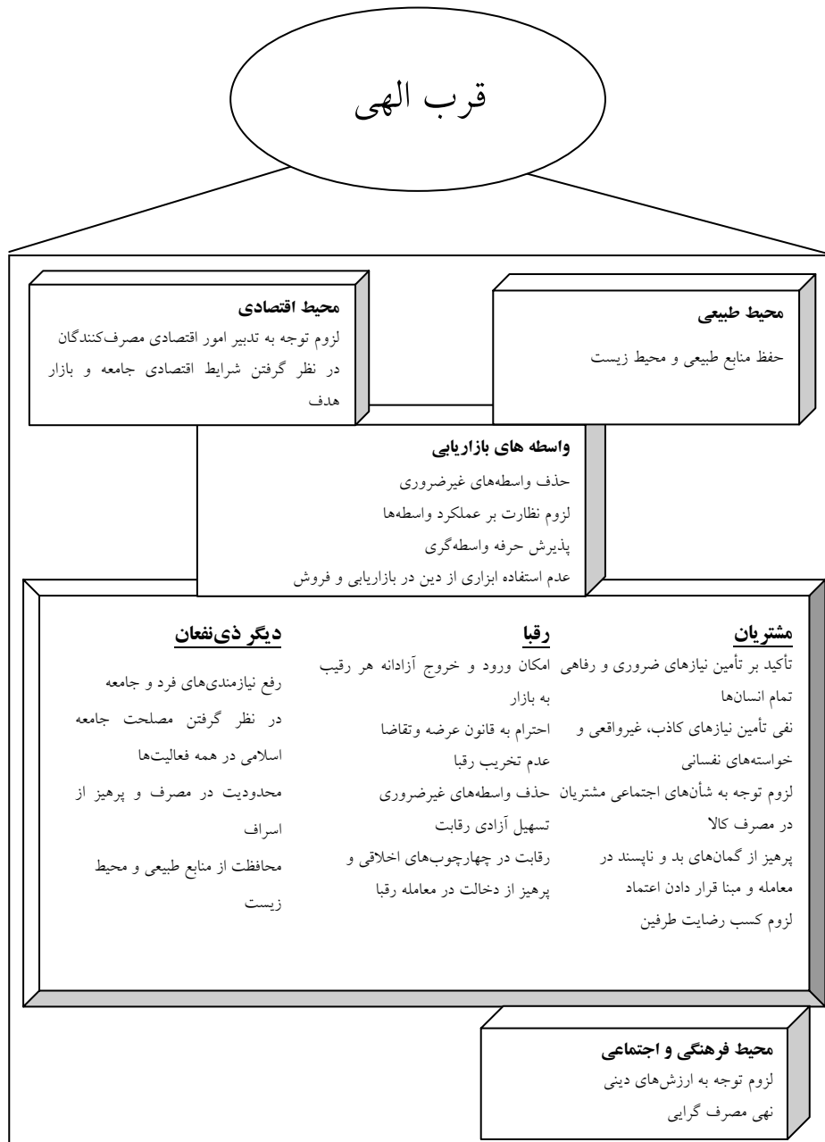
نمودار ۲. مبانی و زیرساخت‌های فرآیند بازاریابی اسلامی