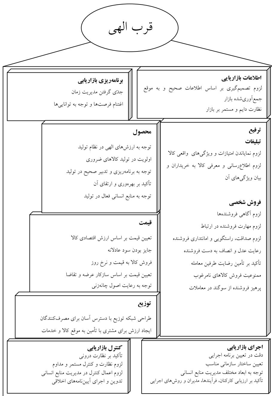
نمودار ۳. مبانی و زیرساخت‌های فرآیند بازاریابی اسلامی